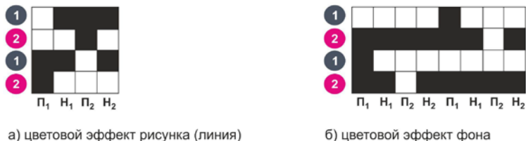
Рис. 3. Модельные переплетения для изготовления шарфа на ткацком станке

Выполнен заправочный расчет ткани, разработаны модельные переплетения для изготовления изделия на автоматическом шестичелночном ткацком станке с программным управлением SLXP 540/1 S 550; жаккардовой машиной с программным управлением LX 1602 фирмы Staubli (рис. 3).