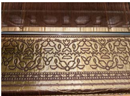
Рис. 1. Фрагмент шарфа по мотивам слуцких поясов

Разработана коллекция шелковых шарфов по мотивам слуцких поясов, фрагмент одного из которых, выполненный в материале, представлен на рисунке 1.