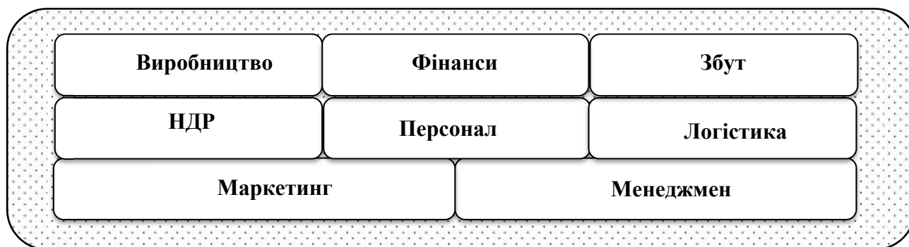
Рис. 1. Елементи внутрішнього середовища

До елементів внутрішнього середовища відносяться (рис. 1): персонал підприємства, фінанси, виробництво, науково-дослідні роботи, збут, логістика, організаційна структура підприємства та менеджмент, маркетинг (цінова політика, товарна політика, збутова політика, комунікаційна політика). Ендегенне середовище входить в категорію факторів, що контролюються підприємством.