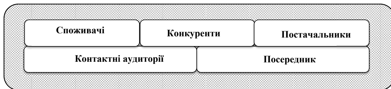
Рис. 2. Елементи мікросередовища

Елементи зовнішнього середовища можна розділити на дві групи. До першої групи належать елементи мікросередовища (рис. 2), до яких відносяться суб'єкти ринку, безпосередньо пов'язані з діяльністю підприємства: споживачі, постачальники, конкуренти, посередники, контактні аудиторії. Під контактною аудиторією розуміються групи юридичних і фізичних осіб, що протидіють або сприяють досягненню цілей підприємства, пов'язані з підприємством системою взаємного обміну інформацією. Вивчення елементів мікросередовища здійснюється при проведенні SWOT-аналізу.