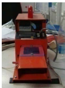
Рис. 2. Прилад PERMETEST

Відносна паропроникність P [%] полотен досліджувалась на приладі «PERMETEST» виробництва Чеської республіки (рис.2).