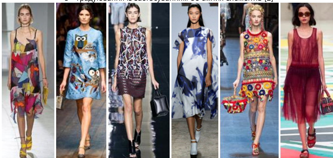
а б в г д е