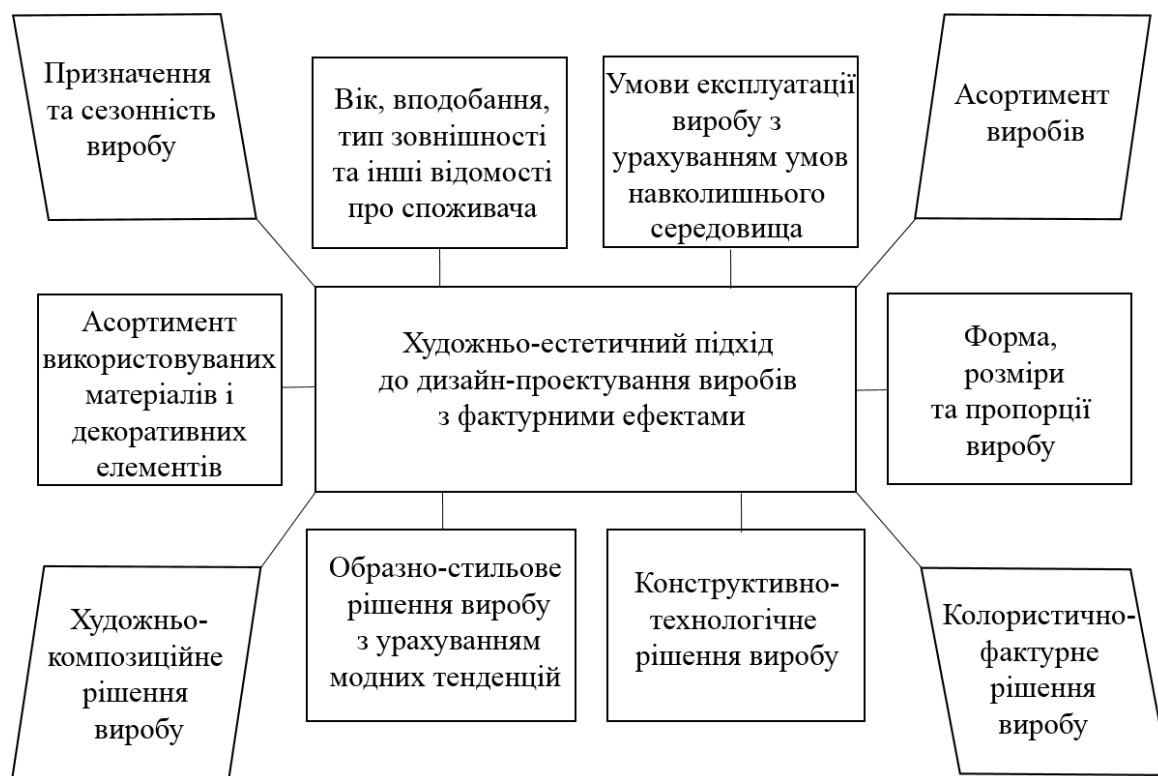
Рис. 1. Складові художньо-естетичного підходу до дизайн-проекування виробів з фактурними ефектами

залежить від їх асортименту. Найбільш поширеними різновидами плоского оздоблення є вишивка, аплікація, друк, мармурування, штучне зістарювання, витравлювання, виварювання, фарбування тощо [1].