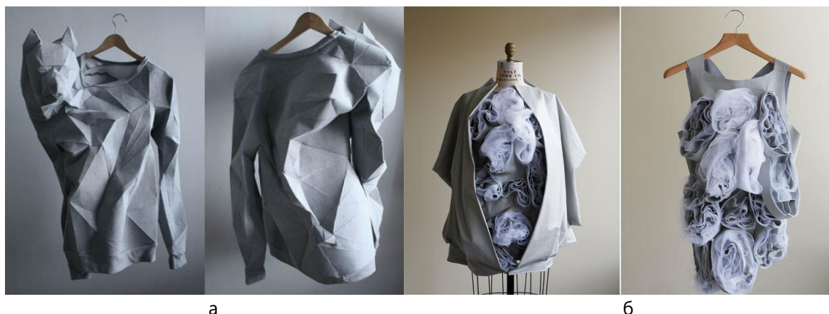
Рис. 5. Приклади образно-стильових рішень виробів з різними фактурними ефектами: а – застосування техніки орігамі в одязі авангардного стилю; б – використання елементів з об'ємними фактурними ефектами в одязі романтичного стилю [12]