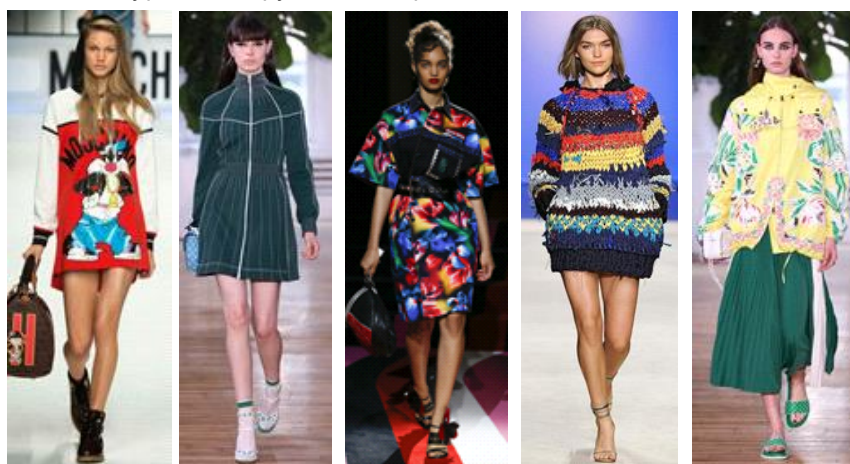
а б в г д