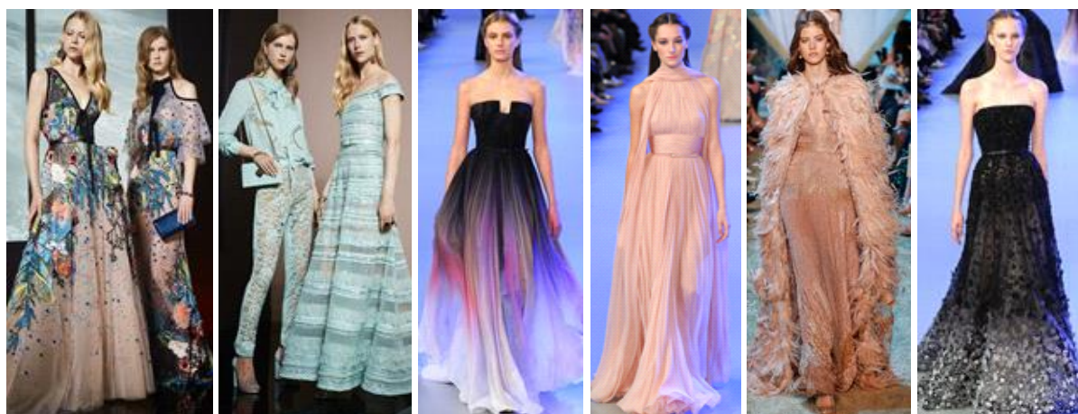
а б в г д е