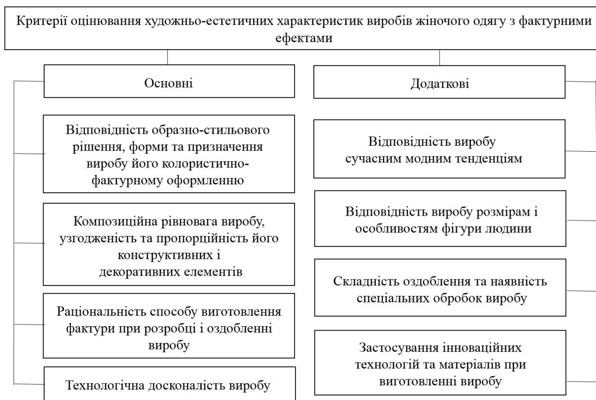
Рис. 7. Систематизація критеріїв оцінювання художньо-естетичних характеристик виробів жіночого одягу з фактурними ефектами

Висновки. Визначено можливі шляхи формування інформаційної бази та запропоновано художньо-естетичний підхід до створення композиційно цілісних виробів з фактурними ефектами, який сприяє поглибленню знань у сфері дизайн-проекування та дозволяє раціонально розширити асортимент моделей виробів. Доведено безпосередній вплив властивостей структури поверхні матеріалу на кінцевий образ виробу в контексті його естетичної досконалості.