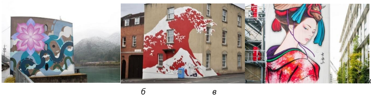
Рис. 7. Мурали Японії