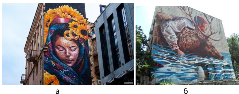
Рис. 12. а – мурал «Берегиня», художник Мата Руда (Коста-Ріка), м. Київ; б – мурал «Переправа», художник Фінтан Маггі (Великобританія)