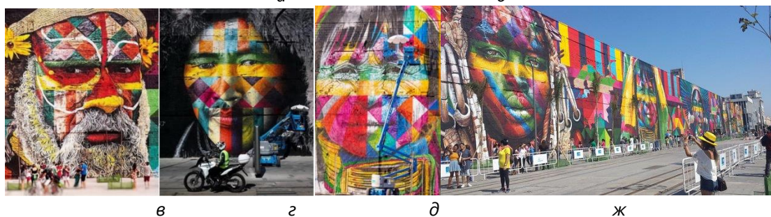
Рис. 6. а, б – революційні мурали, м. Сантьяго, Кокабамба; в, з, д, ж – мурал Е. Кобри