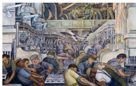
Рис. 1. а – печера в Іспанії з поліхромним кам'яним живописом епохи верхнього палеоліту; б – антична фреска з острова Крит; в – мистецтво муралу, Великобританія, ХХ ст.