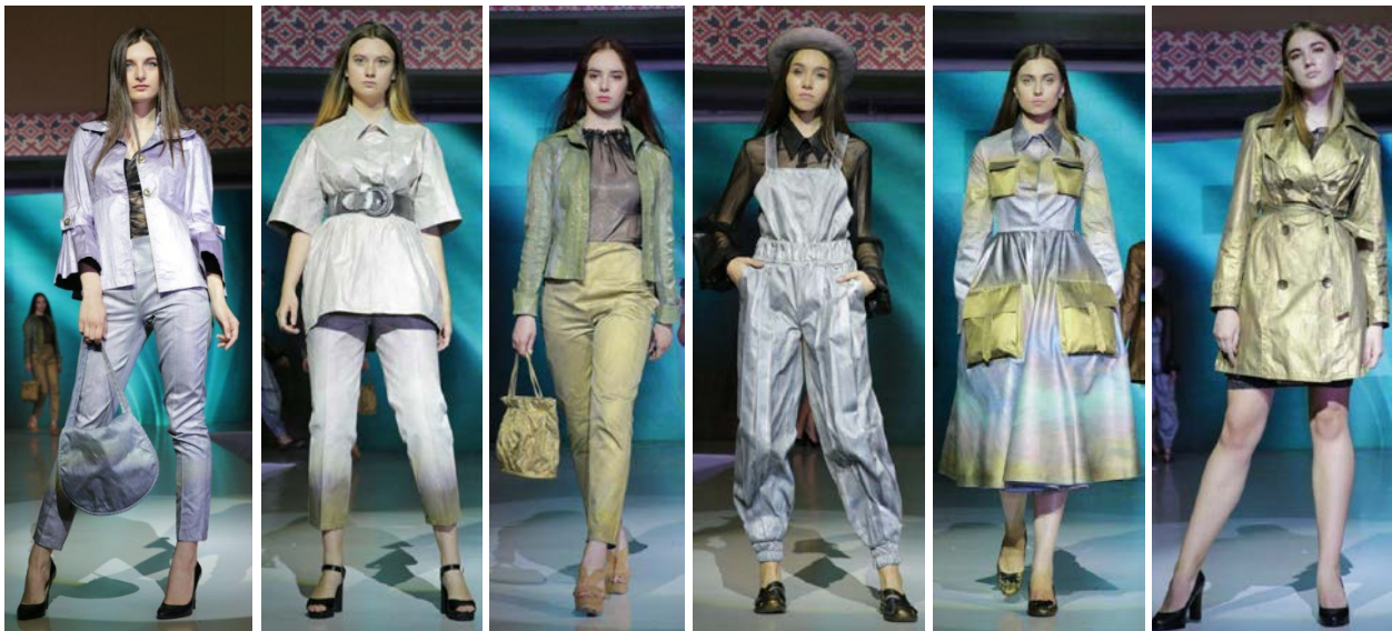
Рис. 4. Фото моделей колекції «Галоген» (автор Вінтоняк І.М.)

Авторська колекція «Галоген» представлена у фіналі міжнародного конкурсу молодих модельєрів-дизайнерів «Печерські каштани» (м. Київ, КНУТД) у номінації «Прет-а-порте де люкс» у 2018 році (рис. 4).