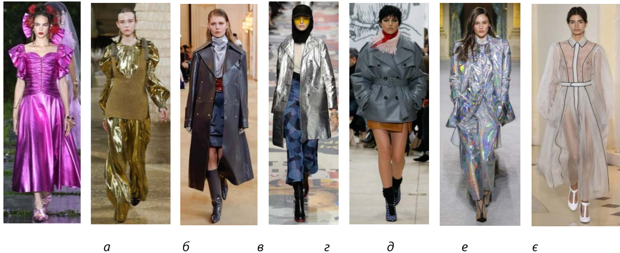
Рис. 1. Моделі одягу за актуальними тенденціями моди: а – металізовані тканини Rodarte SS19; б – об'ємні рукави Ulla Johnson SS19; в – металізовані тренчі Nina Ricci FW 18/19; г – колір металік Christian Dior FW 18/19; д – куртка oversize Miu Miu FW 18/19; е – монолук Balmain FW 18/19; є – прозорі тканини Emilia Wickstead SS18 [8]

поєднувати в окремі образи. Моделі одягу за актуальними тенденціями моди надано на рис. 1.