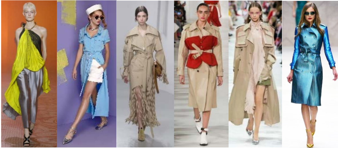
Рис. 2. Моделі за актуальними тенденціями моди: а – яскраві кольори Poiret FW 18/19; б – сукня-сорочка aTaN SS18; в – рвана бахрома у моделях Loewe SS18; г – стилізований пояс в колекції Maison Margiela SS18; д – плащ з кишенями на плечах Valentino SS18; є – плащ з металізованої шкіри Burberry SS18 [8]

поверхні різноманітних ефектів, колористичного забарвлення дає можливість розробляти нові актуальні моделі одягу.