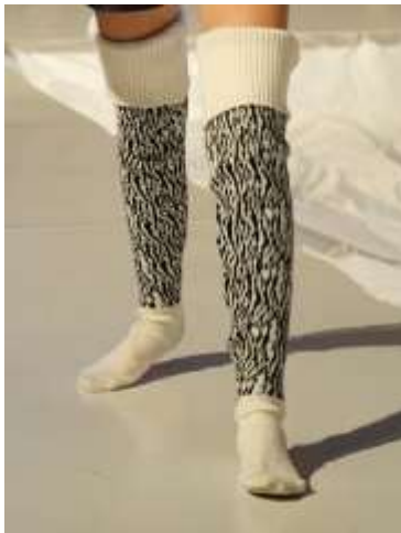
Рис.1. Панчішно-шкарпетковий виріб

рис.1. Панчішно-шкарпетковий жіночий виріб, виконаний у вигляді панчіх, що включають мисок, слід, п'ятку, поголінок, візерункову центральну частину та борт. Візерункова частина виконується переплетенням подвійний неповний двоколірний чорно-білий жакард. Візерункова центральна частина оздоблена стилізованим тваринним орнаментом, що імітує окрас зебри рис.2. Борт зв'язаний переплетенням ластик 2+2. Паголінок, слід, мисок та п'ятка вив'язані переплетенням ластик 1+1. Такі переплетення дозволяють виробу вільно прилягати до ноги, що надає візуальне відчуття об'єму та імітує виріб у вигляді панчіх ручної роботи. Колористичне рішення побудоване на поєднанні контрастних кольорів. При виготовленні промислового зразка використано білий та чорний колір пряжі. Виріб виготовлено з напіввовняної пряжі, що задовольняє більшість потреб споживача при використанні даного асортименту. До переваг напіввовняної пряжі є її теплозахисні властивості, досить висока гігроскопічність та практичність у використанні.