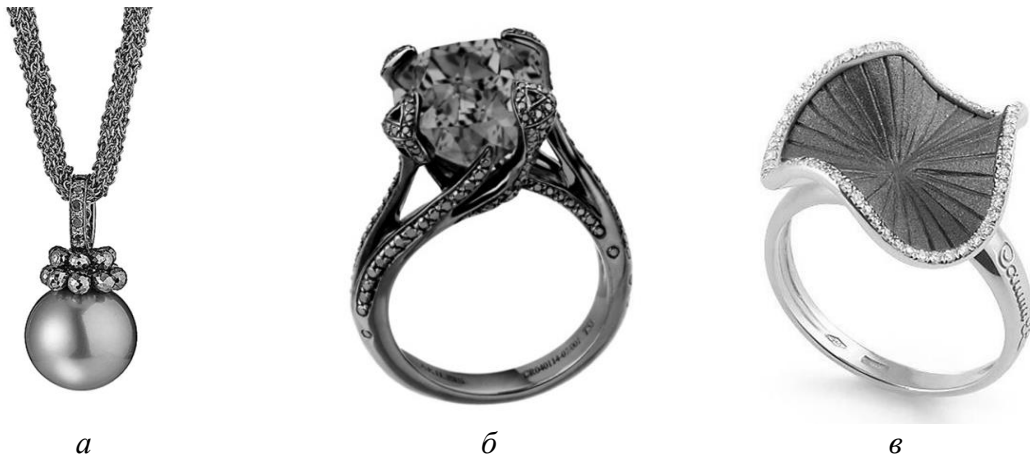
Рис. 2. Застосування кольорового золота у ювелірних виробках: