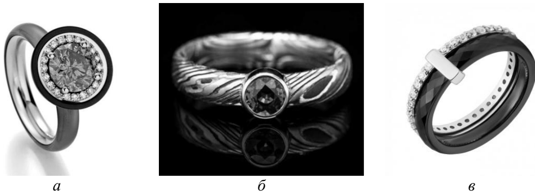
Рис. 4. Каблучки: