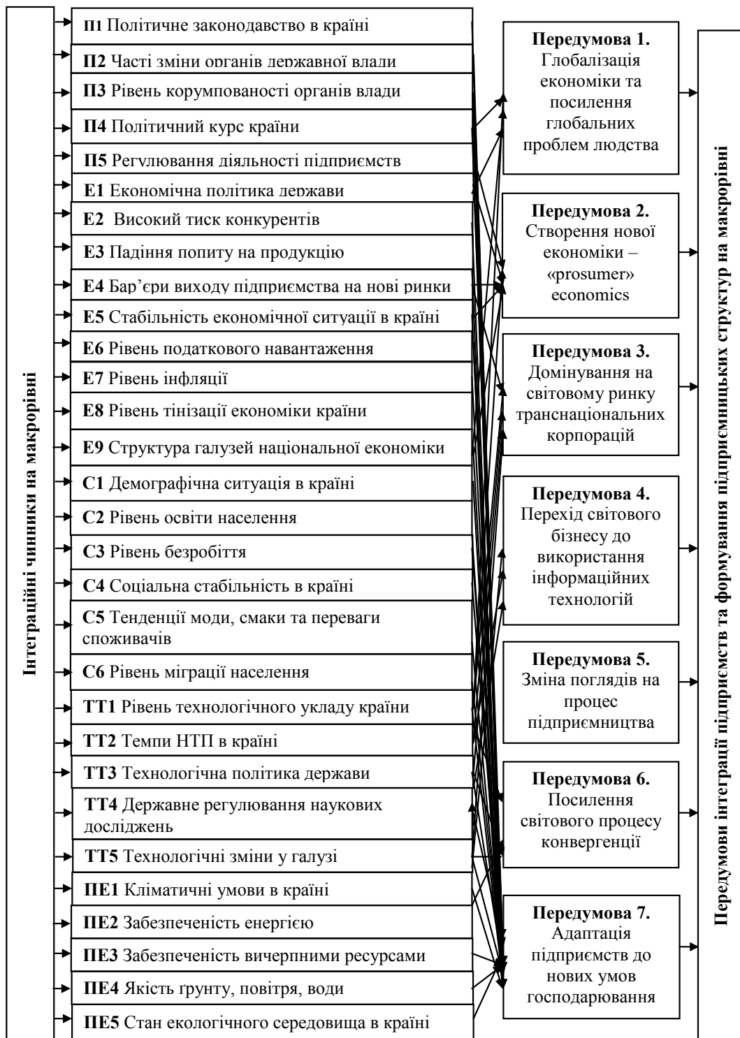
Рисунок 3 – Чинники-передумови інтеграції підприємств та формування підприємницьких структур на макrorівні

розвитку, в основі якого лежать загальні тенденції та імперативи науково-технічного й соціально-економічного прогресу, що зумовлюють зближення (тобто конвергенцію) економік зростаючої кількості країн за збереження їхніх національних особливостей. Так само рівень розвитку сучасного підприємства, яке поступово перетворюється у складну інтегровану під-