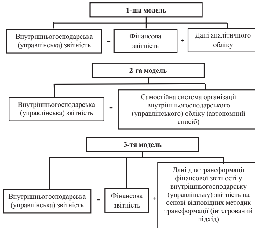
Рис. 2. Моделі формування внутрішньогосподарської (управлінської) звітності в залежності від організації внутрішньогосподарського (управлінського) обліку на підприємстві (Розроблено на основі досліджень Н.А. Ковальової [1, с. 15])

Слід зазначити, що в рамках п'ятого рівня, що регулює організацію бухгалтерського обліку на рівні суб'єкта господарювання можливо інтегрування внутрішніх нормативних документів для управління, в межах якого рекомендується сформувати трирівневу систему внутрішньої документації для цілей внутрішньогосподарського (управлінського) обліку та внутрішньогосподарської (управлінської) звітності підприємства.