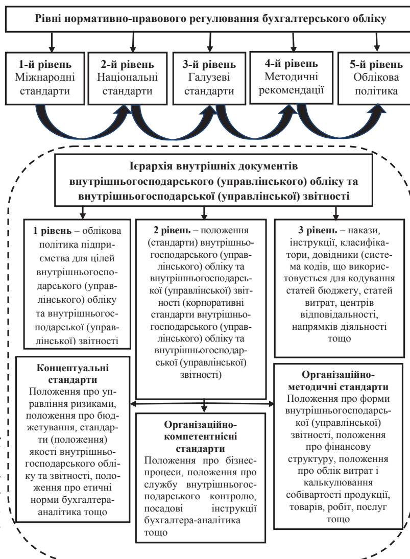
Рис. 1. Система регламентації внутрішньогосподарського (управлінського) обліку та внутрішньогосподарської (управлінської) звітності підприємства (Розроблено на основі досліджень Н.А. Ковальнової [1, с. 13])

Система регламентації внутрішньогосподарського (управлінського) обліку та внутрішньогосподарської (управлінської) звітності підприємства наведена на рис. 1.