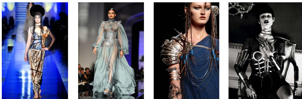
Рис. 3. Моделі одягу дизайнера Жан-Поль Готьє (А/В 2009/10 – Spring 2010)

матеріали, як метал, пластик тощо. Образні трансформації моди набувають в контексті дизайну одягу своїх особливих ознак.