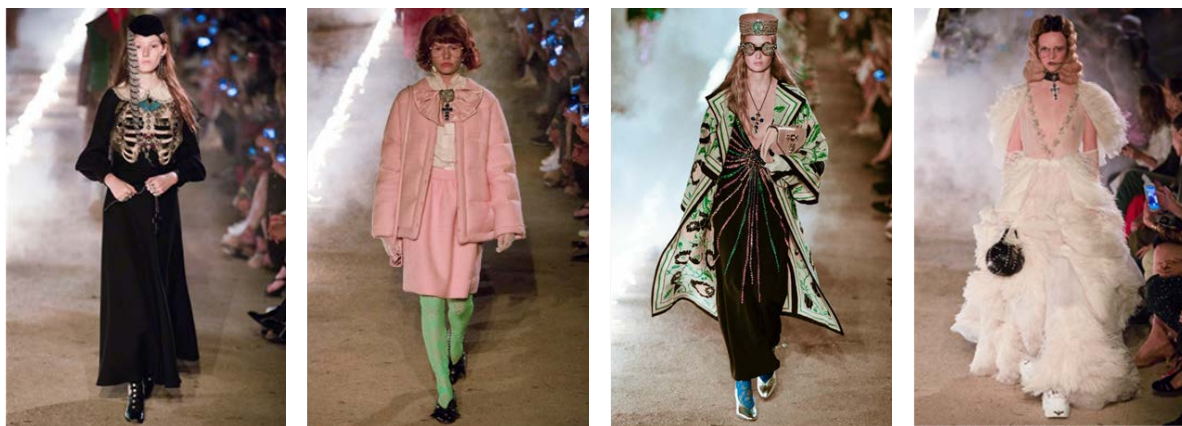
Рис. 1. Моделі дизайнера Алессандро Мікеле для бренду «Gucci» на тему-Середньовіччя