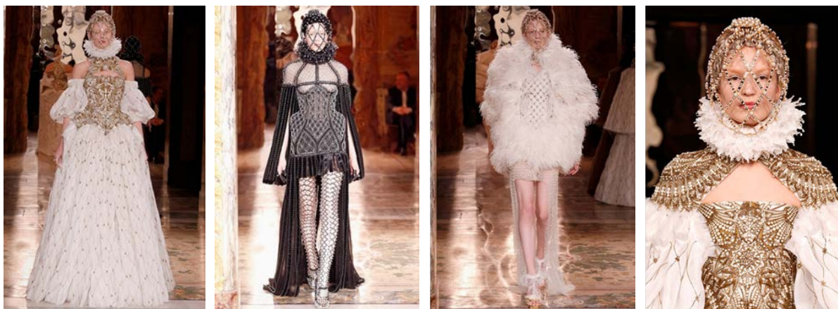
Рис. 2. Моделі зі колекції осінь-зима 2013–2014 рр. дизайнера Олександр Маккуїн за мотивами костюмів королеви Єлизавети

Джон Гальяно в колекції для «Dior», сезону осінь-зима 2006–2007 рр., трансформував тему середньовіччя у золоті напівпрозорі, подвійні сукні, використавши багат шаровість історичного костюма з одного боку, з іншого боку сукня, була виконана з металевих матеріалів, що нагадують лицарські обладунки, за рахунок чого вдався образ дівчини-войовниці [13].