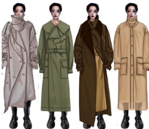
Рис. 6. Ескізний проект моделей верхнього одягу авторської перспективної колекції ділового стилю для молодих жінок

Виконання морфологічного аналізу, дало змогу обрати найбільш вдалі варіанти моделей, на основі яких було розроблено ескізний проект авторської перспективної колекції ділового стилю для молодих жінок. Кожна модель майбутньої колекції відповідає сучасним тенденціям світових трендів моди, використані стилізовані елементи та деталі епохи середньовіччя. Враховуючі світову тенденцію в моді стирання граней між чоловічим і жіночим одягом, чоловіки теж можуть використати деякі речі з колекції для свого гардеробу.