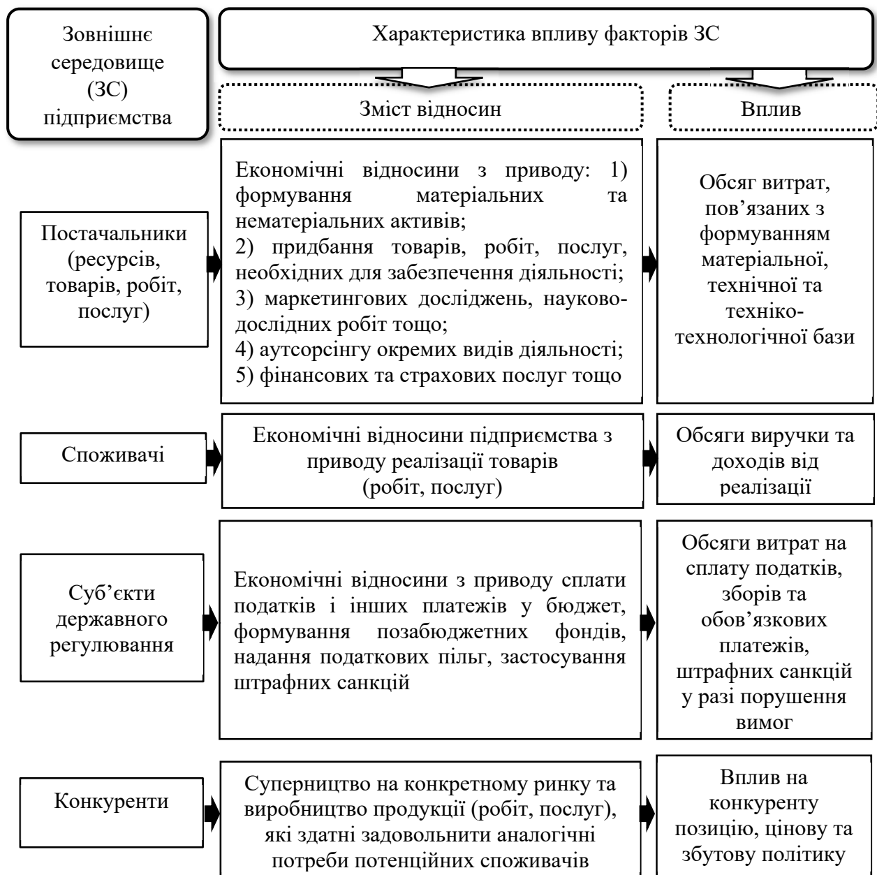
Рис. 4. Зовнішні прямі фактори впливу на ФСП

Фактори опосередкованого впливу включають всі ті, що не мають безпосереднього й негайного впливу на ФСП, проте саме вони в довгостроковій перспективі можуть визначати її рівень, і обов'язково мають враховуватись при розробці планів та бізнес-стратегії підприємства, бути ідентифіковані та оцінені. При цьому в процесі їх дослідження доцільно спиратися на результати застосування прогностичного інструментарію. Слід підкреслити, що фактори цієї групи є складними, не входять до групи керованих та контрольованих, відповідно, в процесі управління ФСП мають бути сформовані відповідні адаптивні механізми, що дозволять