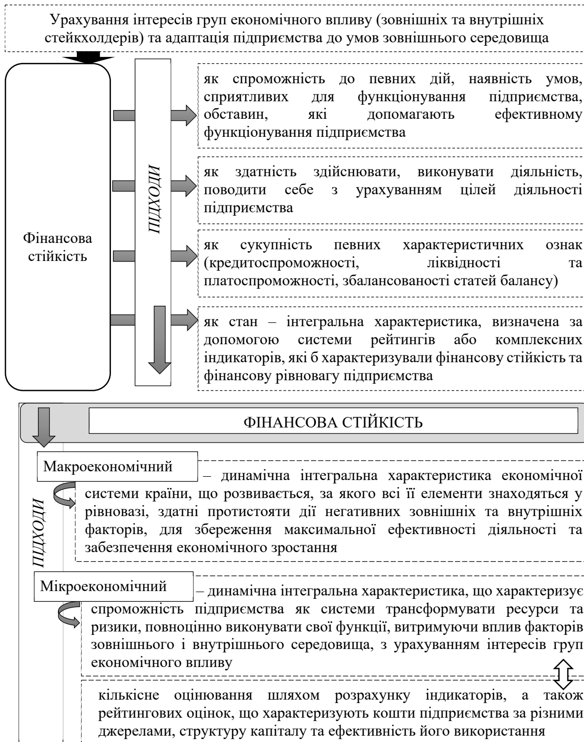
Рис. 1. Узагальнення підходів до визначення поняття «ФСП»

розглядаються в працях вітчизняних (О. Герога [4; 5], Л. Докієнко [6], М. Заюкова [8], В. Лазоренко [12–13], Н. Мамонтова [15], І. Нагорна [18], В. Плиса та І. Приймак [20–22], Ю. Русіна та Ю. Полозук [23]) та закордонних (Е.П. Девіс, М.Р. Стоун [1], К. Дж. Кім, К. Лі, Х. Ан [2]) науковців.