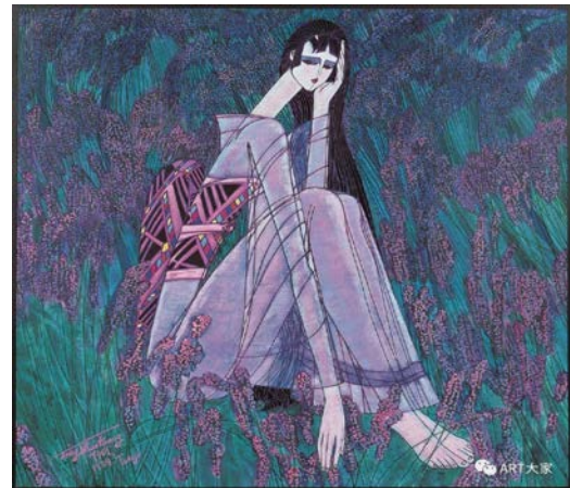
Іл. 4. Дін Шаогуан «Фіолетовий сад», 1988 р. Олія, 100×100 см. Місце зберігання: приватна колекція, Китай