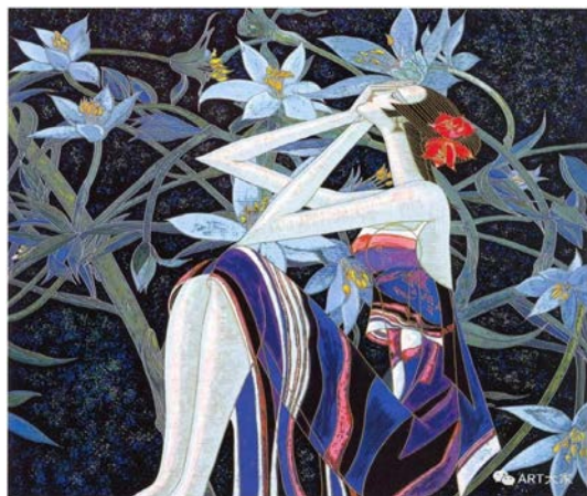
Іл. 5. Дін Шаогуан «Мрія», 1993 р. Олія, 80×80 см. Місце зберігання: зібрання Художнього музею Сішунбаньна, Китай