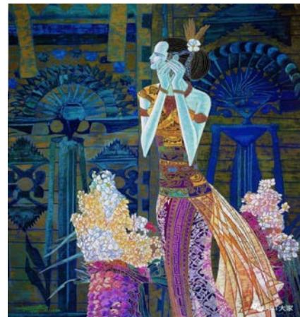
Іл. 6. Дін Шаогуан «Рясний врожай», 1994 р. Олія, 180×160 см. Місце зберігання: зібрання Художнього музею Юньнана, Китай