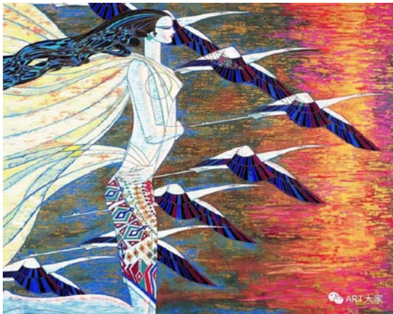
Іл. 3. Дін Шаогуан «Град і сонячне світло», 1990 р. Олія, 150×130 см. Місце зберігання: зібрання Національного художнього музею Китаю, Пекін, Китай