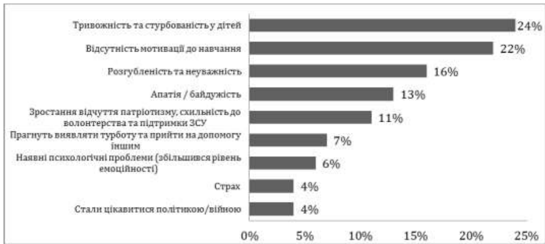
Рис. 3. Ознаки прояву стресу та інші зміни у портреті учня. Джерело: [1]

Для надання ефективної психологічної підтримки важливо розуміти обумовленість деяких психологічних проблем педагога в професійній сфері його особистісною структурою. Таке розуміння дає змогу здійснювати своєчасну профілактику можливих конфліктів і негативних емоційних станів з урахуванням слабких сторін характеру, а також визначати оптимальний шлях подальшого особистісного розвитку й розкриття потенціалу особистості на основі її сильних рис. Для діагностики структури особистості психолог може використовувати такі методики, як СМІЛ (ММРІ), Діагностичний тест особистісних розладів (В. П. Дворченко), Опитувальник особистісних акцентуацій (Леонгард - Шмишек), Операціоналізовану психодинамічну діагностику (ОПД - 2).