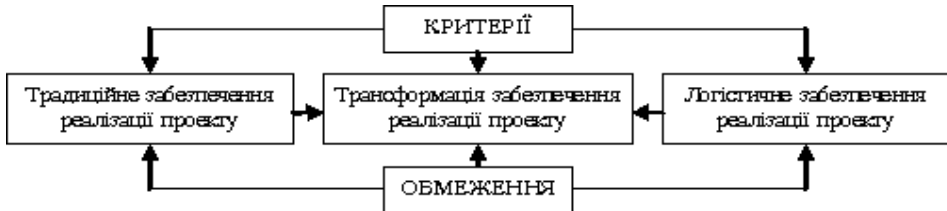
Рис. 2. Процес трансформації традиційного забезпечення реалізації проекту в логістичне, побудовано за даними [4; 9]

проекту розвитку, оптимізацію й раціоналізацію всіх економічних потоків в рамках проекту. Логістизація процесу реалізації проекту розвитку розвиває такі види забезпечення проекту, як маркетингове, організаційне, правове, які залишаються самостійними внаслідок специфіки його функціонування.