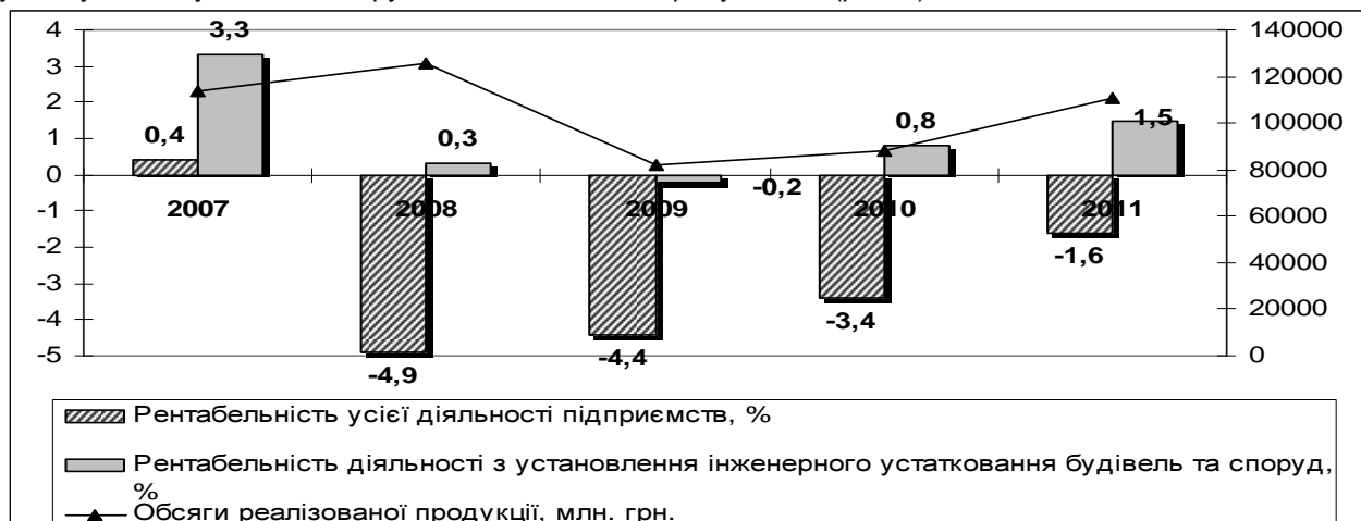
Рис. 1. Результати економічної діяльності підприємств галузі будівництва

Виключенням є підприємства сфери будівництва, що здійснюють установлення інженерного устаткування будівель та споруд, діяльність яких є прибутковою (рис. 1).