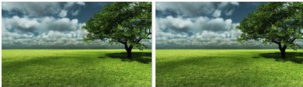
Рис. 4. Зображення-контейнер до та після шифрування