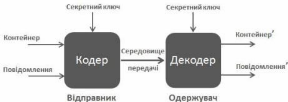
Рис. 1. Базова модель стегосистеми

Секретна інформація представлена у вигляді зображення з можливим розширенням: .BMP, .GIF, .PNG, .JPEG або звичайним текстом.