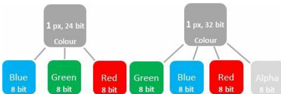
Рис. 2. Пікселі зображення з глибиною кольору 24 та 32 біти

Кожен колір кодується одним байтом (8 біт). В BMP таких кольорів три (червоний, зелений та синій), загалом 3 байта по 8 бітів (BMP з глибиною кольору 24 біта) (рисунок 2).