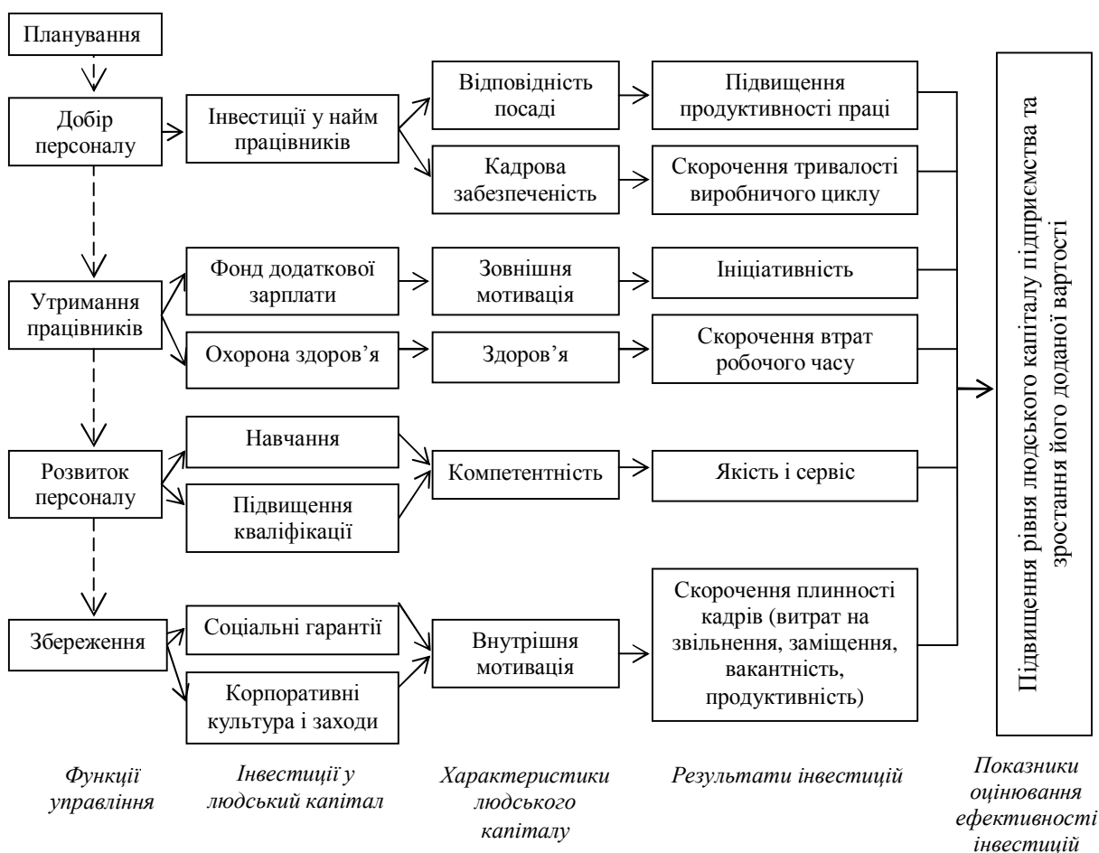
Рис.2. Створення доданої вартості в результаті інвестицій у людський капітал підприємства (розроблено автором на основі [5; 6; 7; 8])

Оцінювання економічної ефективності інвестицій у людський капітал ґрунтується на принципах раціональної економічної поведінки. Це означає, що рішення щодо вкладення обмежених ресурсів приймається за умови перевищення одержаних вигід над здійсненими витратами. Витрати на людський капітал на всіх рівнях звичайно враховують і той прибуток, який міг би бути одержаний при альтернативному використанні коштів.