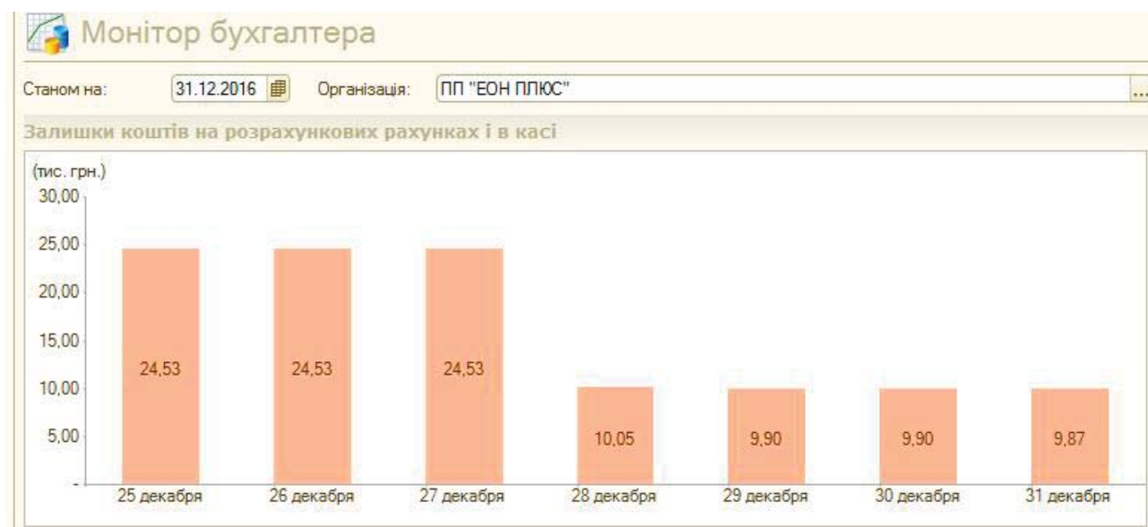
Рис. 1. Залишки коштів на розрахункових рахунках і в касі у вкладці «Монітор»

пропонується розбити загальний стовпець окремо на касу підприємства і окремо на розрахункові рахунки підприємства.