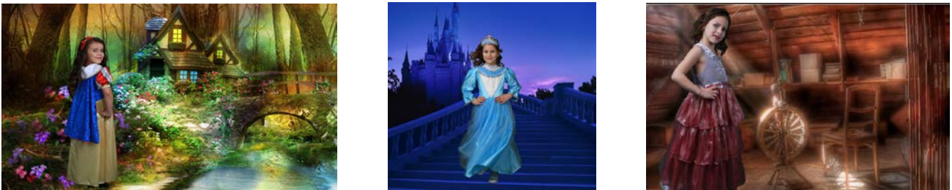
Рис.3. Постпродакшн створення дитячого образу

Процес моделювання дитячих зачісок складається з тих самих етапів, що і процес моделювання зачісок для дорослих, але ця область моделювання містить деякі обмеження або доповнення, викликані суворими вимогами, які базуються на особливостях віку і психології дитини. Під час моделювання зачісок для дітей необхідно враховувати особливості статури і психологію дитини в різні періоди її росту, вимоги гігієни та педагогіки [1, ст. 181].