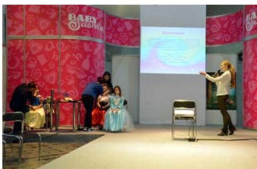
Рис. 5. Проведення майстер-класу зі створення дитячого образу на виставці Baby-expo-2016

Режисерський трітмент і продакшн-бриф визначають завдання для кастингу: скільки моделей, акторів необхідно для зйомок, їх вік, стать, типаж, акторські дані.