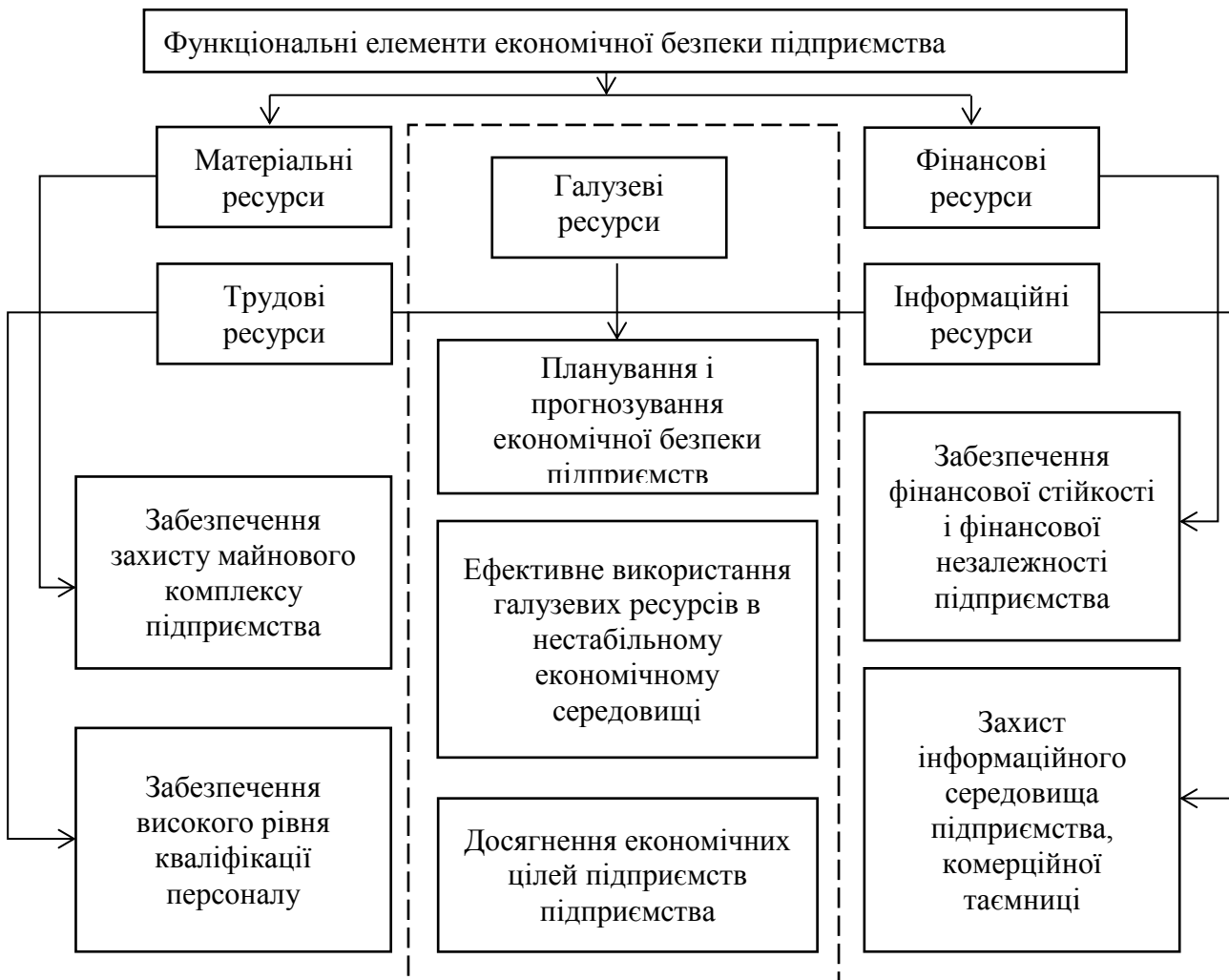
Рис.2. Структура основних функціональних елементів і напрямів забезпечення економічної безпеки підприємства

інформаційні ресурси підприємства, необхідно сформувати, власне, і основні напрями забезпечення [5, 6].