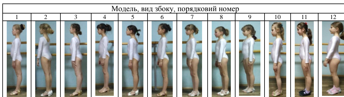
Таблиця 1 – Фотовідбитки дівчаток молодшої шкільної вікової групи у тренувальних купальниках

Параметри визнаних дефектів дозволили встановити необхідність внесення змін у вихідну конструкції суцільного купальника, від коректувати її відповідно до вихідного стаціонарного положення фігури для занять бальними танцями.