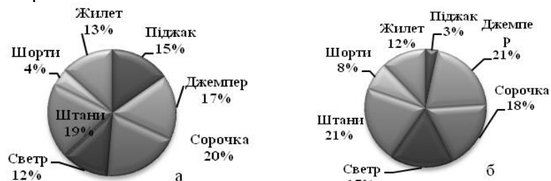
Рисунок 3 – Гістограма результату анкетного опитування батьків та хлопчиків щодо вибору асортименту форменого одягу: а-батьки;б- хлопчики

На другому етапі досліджень для обґрунтування асортименту та комплектності шкільної форми було проведено анкетування потенційних споживачів. Анкетування проводилось у загальноосвітніх навчальних закладах м. Києва. В анкетуванні прийняло участь 50 школярів віком від 6,5 до 8,5 років та їх батьки. Аналіз результатів анкетного опитування показав, що понад 70% батьків школярів молодших класів вважають необхідним носіння шкільної форми. Переваги щодо асортименту виробів, що входять в комплект надано на рис.3.