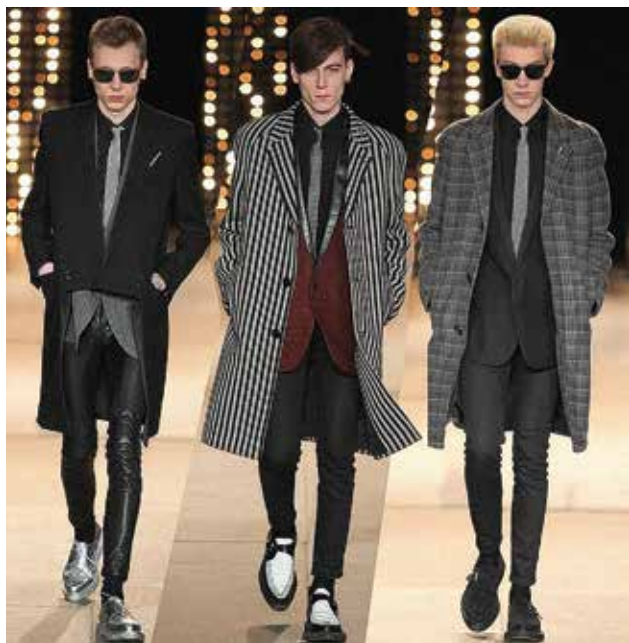
Ил. 1. Модели в стилистике «тедди-бойз» из мужской коллекции Saint Laurent (осень-зима 2015)

Evolution of subcultures and their antipodes having noticeable influence on forming of mass fashion