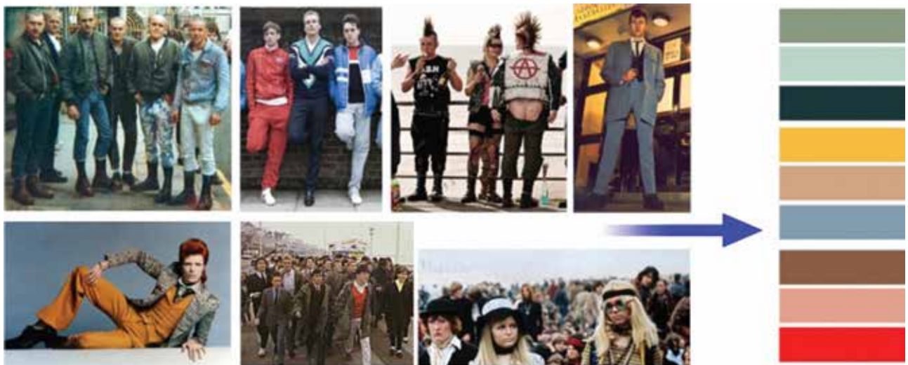
Ил. 2. Палитра наиболее характерных цветов (на основе ассимиляции цветовых характеристик субкультур)