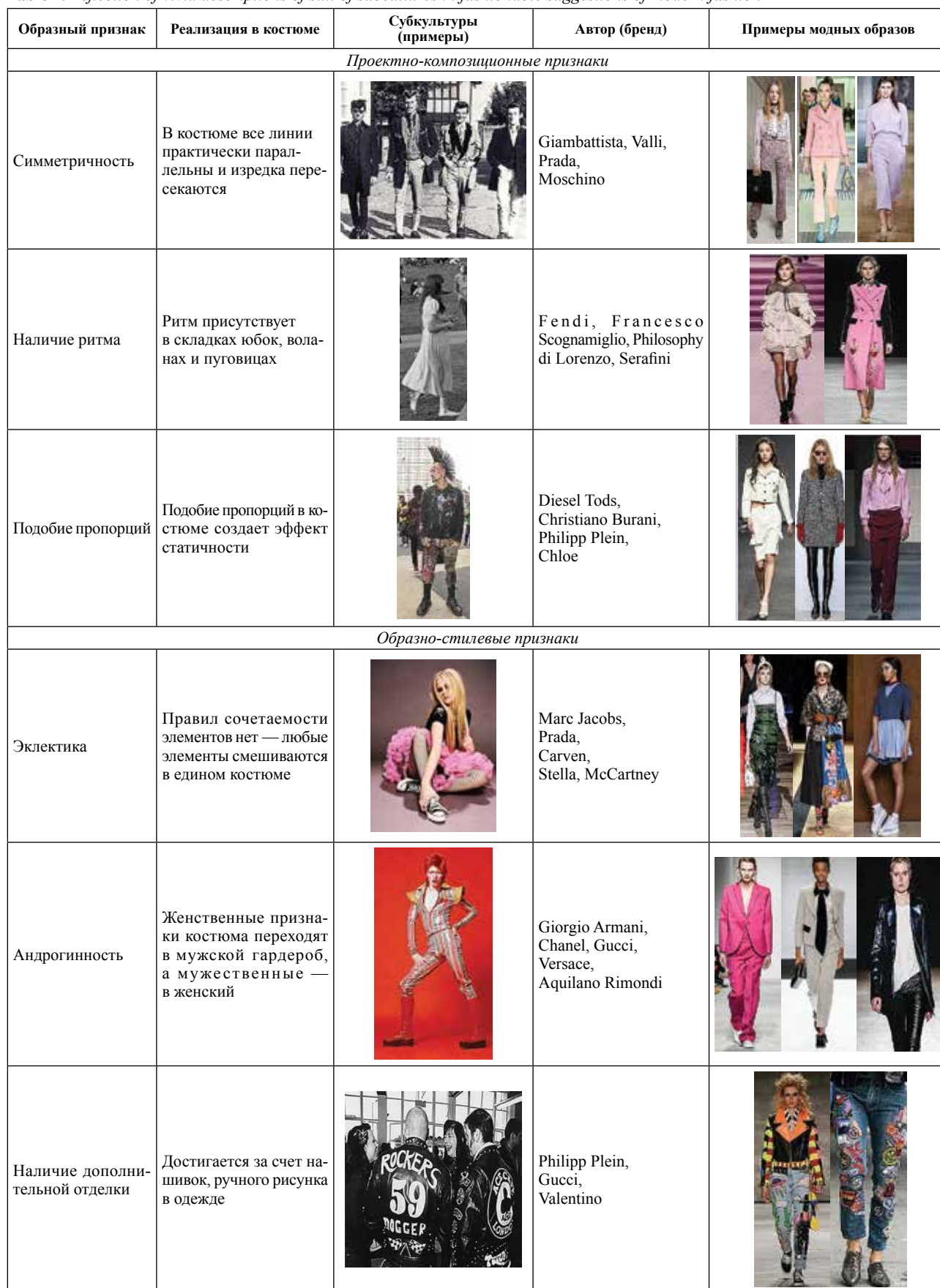
Таблица 2. Отражение образных характеристик костюма субкультур в модных предложениях современной моды Table 2. Reflection of vivid descriptions of suit of subcultures in fashionable suggestions of modern fashion