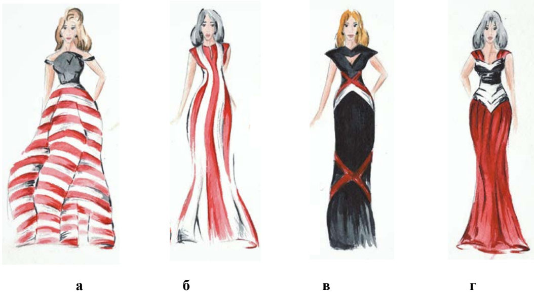
Рис.2. Приклади використання ефекту зорових ілюзій в композиції костюма

- колірних плям, які дозволяють створити і забезпечити власний ритм системи, визначаючи при цьому динаміку форми (рис.2,г).