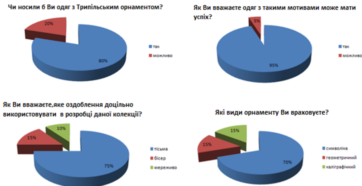
Рис. 5. Результати анкетування споживачів

Метою дослідження переваг споживачів в побудові форми та визначенні художньо-композиційних характеристик одягу, що проектується, були розроблені анкети опитування. До складу анкет включені питання, що характеризують ступінь зацікавленості споживачів у використанні досліджуваного культурного надбання, основні естетичні характеристики сучасних моделей, засоби формоутворення та прийоми оздоблення. Результати обробки даних опитування представлено на (рис. 5). Вони показали високий ступінь зацікавленості споживачів у використанні мотивів костюма періоду Трипільської культури в проектуванні сучасних моделей одягу.