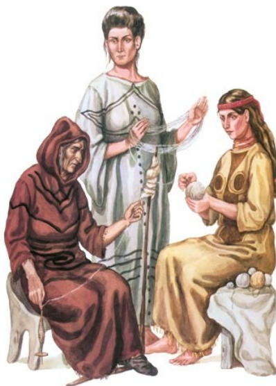
Рис. 3. Використання шерсті домашніх тварин для в'язання

шерсть домашніх тварин використовували для приготування вовняних тканин або в'язання (рис. 3).