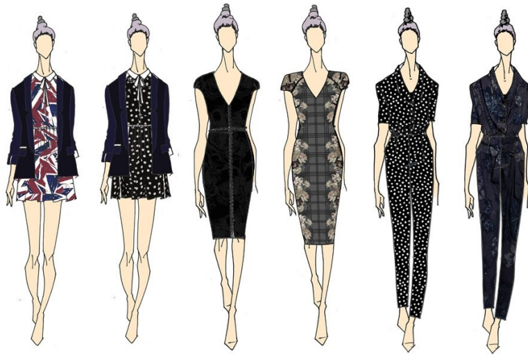
Рис. 7. Колекція жіночого одягу за мотивами Трипільської культури

Побудова блоків колекції та розвиток асортиментних рядів базувались на визначенні елементів структурного формоутворення та базових знаках-символах форми моделей, які були обґрунтовано виявлені в результаті проведення морфологічного аналізу (рис. 8).