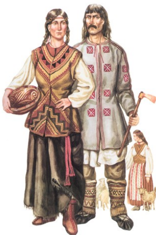
Рис. 1. Художня композиція одягу періоду Трипільської культури

Відчуття ритму орнаментальних композицій, які несли в собі не тільки пластично-гармонійні високохудожні якості, а й символи конкретного змісту, лягло в основу як розпису керамічного посуду, інтер'єрів, так і декорування одягу. Складені в логічно послідовну систему знаки-символи, повторюючись, створюють пластичну композицію нескінченності життєвих процесів – орнамент життя (рис. 1).