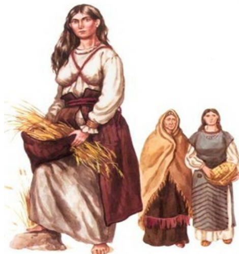
Рис. 2. Зображення форми комплексу історичного одягу трипільців

Формування стилістики трипільського орнаменту з його духовно-символічним змістом відбилосся на всіх видах художньої діяльності людини і, насамперед, у мистецтві оформлення одягу – вишивки, аплікації, розпису. Жіночий одяг часів трипільської культури був різноманітним і багатодекорованим. Надзвичайно пластичні форми з підкреслено характерними особливостями силуетів одягу на них дають можливість модулювати форми одягу, які існували на той час (рис. 2).