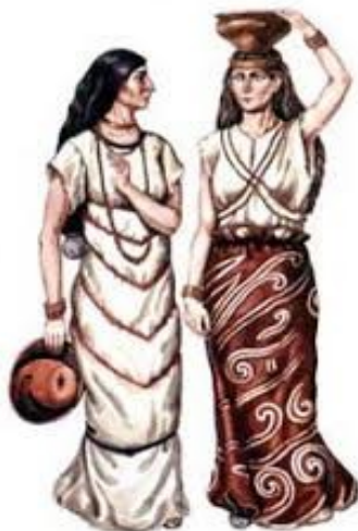
Рис. 4. Орнаментальне оздоблення одягу часів Трипільської культури

поєднанні з багатодекорованим одягом, створювали підкреслено-пластичні силуети, унікальні і самобутні комплекси вбрання, що склалися на території України у V–III тис. до н. е., раніше від розвитку культури Древнього Єгипту (рис. 4).