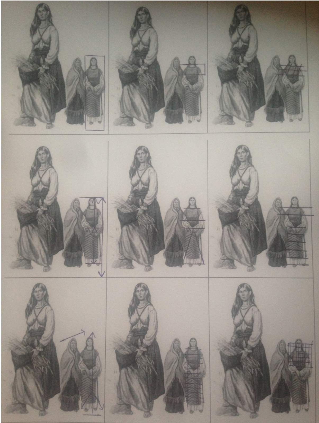
Рис. 6. Системно-структурний аналіз форм костюма Трипільської культури

втрачає його з роками. Виховуючи національну самосвідомість та гордість за високу культуру свого народу (рис. 7).