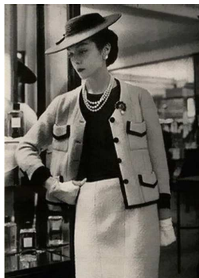
Рис.1. Моделі костюмів кутюр'є Коко Шанель

Мода 50-60-х рр. XX ст. не втрачає актуальності і сьогодні, а навпаки, стає все відомішою та цікавою. Особливо популярна вона у весільних і вечірніх вбраннях (рис. 2). Романтичний, жіночий одяг шують з ошатних матеріалів, що добре драпіруються та мають багате оздоблення. Прилеглий силует забезпечується контрастом затягнутої талії і пишної нижньої частини. Сукні в стилі 1950-х років можуть виглядати досить сучасними або підкреслено вінтажними, що теж відповідає новим тенденціям моди.