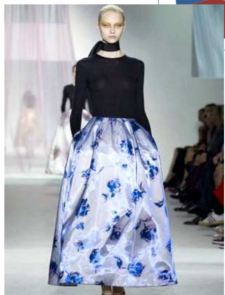
Рис.2. Сучасні сукні в стилі 50-х рр. XX ст.

З метою визначення можливості та доцільності використання форм та художньо-композиційних елементів одягу, періоду формування стилю «New look», було проведено дослідження відношення сучасних споживачів до включення елементів формоутворення