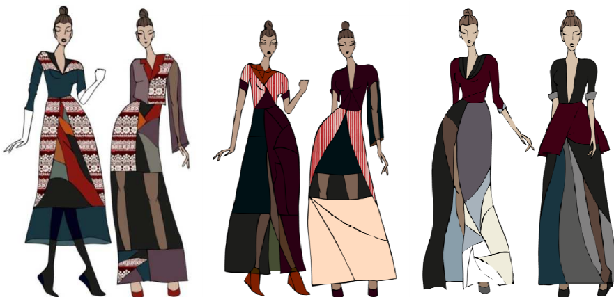
Рис. 6. Розробка сучасної колекції моделей за мотивами моди 50-х рр. XX ст.

Створена сучасна колекція не передбачає широкого тиражування. Кожна річ має свій характер та свої особливості, оскільки вона орієнтована на індивідуального споживача та для особливих випадків (свята, визначні події, весілля). Визначення головних